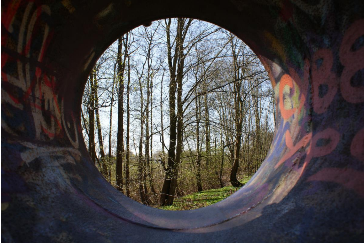
Katrin Meinhardt, Hamburg

Das Bild ist schon vor längerer Zeit (2010) in Itzehoe entstanden. Es symbolisiert, dass die Zeit der Depression wie ein langer enger Tunnel wirkt. Es gibt keine Wege rechts und links davon. Dies zeigen auf dem Foto die doch recht scharfen Abgrenzungen und Linien. Doch irgendwann gelangt man an den Punkt, an dem man sich bewusst wird, dass es auch ein Leben nach der Depression gibt. Man steckt weiterhin in diesem Tunnel, aber mit Blick und Gedanken an das Leben danach. Was auf diesem Foto die Helligkeit, die Schatten, der Himmel und die Bäume symbolisieren. Dass die Bäume kahl sind, symbolisiert, dass man zwar weiß, dass es ein Leben nach der Depression gibt, aber noch keine klare und „bunte“ Vorstellung davon hat bzw. haben kann.