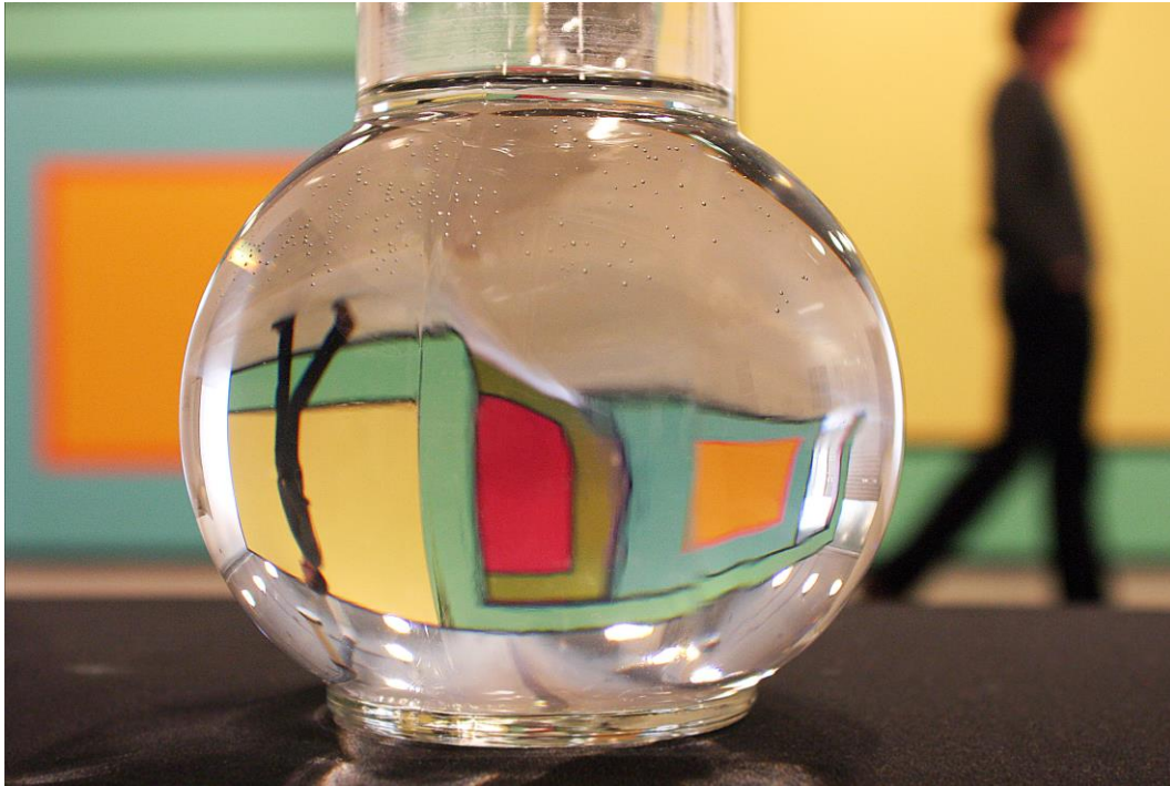
Jeannine Suerdieck, Dresden

Das Bild entstand während einer sehr guten Gemütsverfassung auf einer Reise und Museumsbesuch in Amsterdam.