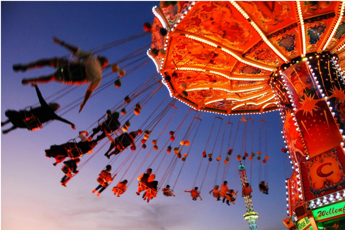
Markus Bundschuh, München

Das Foto wurde 2011 auf dem Oktoberfest in München aufgenommen und zeigt die Unbeschwertheit der Menschen im farnefrohen Lichterglanz des Kettenkarussells bei Ihrem „Flug ins Blaue“.