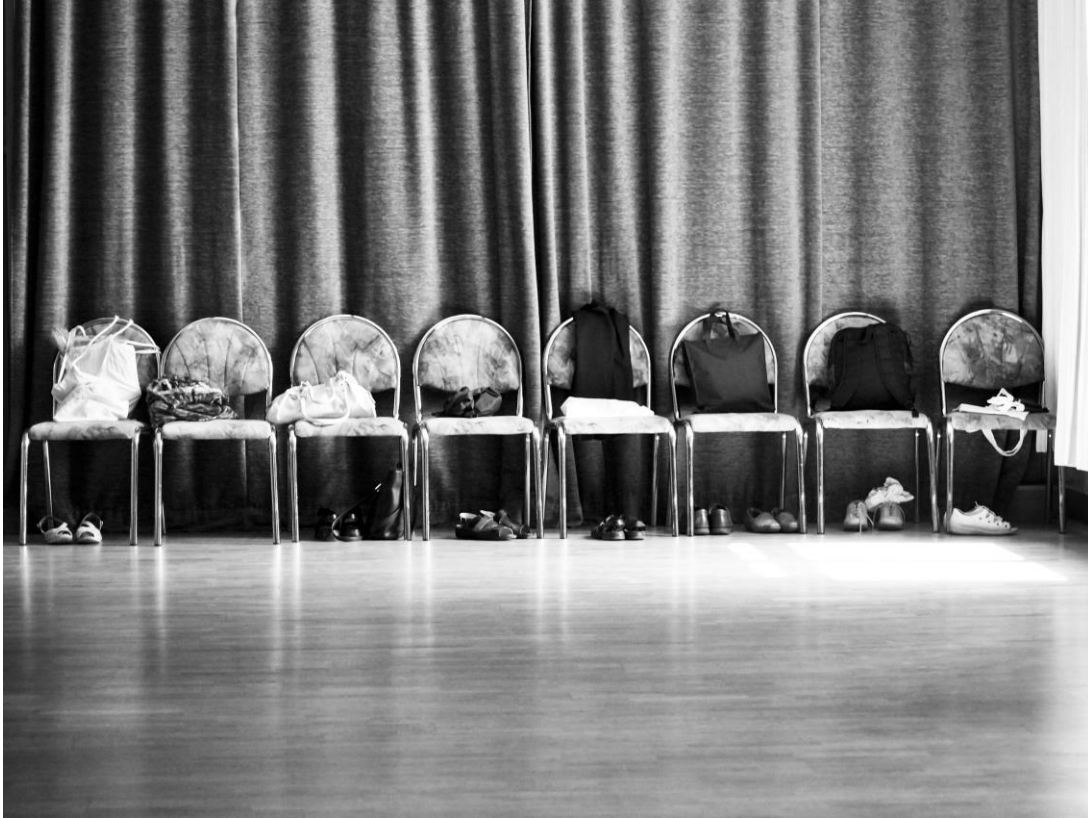
Sibylle Kölmel, Leipzig

Das Bild entstand im Rahmen einer Reportage über eine Ehrenamtliche, die (noch zu DDR-Zeiten) einen Gesprächskreis für psychisch kranke Menschen mit begründete, lange begleitete und später einen Tanzkreis aufbaute, in dem – seit nunmehr 17 Jahren – psychisch Kranke mit „Gesunden“ einmal in der Woche für anderthalb Stunden zusammen tanzen.